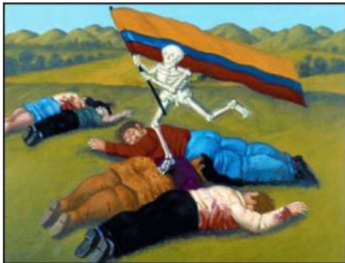
Fernando Botero, "La barbarie", 1999

Se calcula que el conflicto tuvo un costo anual de un 3% del PIB y frenó la inversión extranjera, así como la economía nacional.