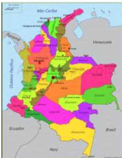
Mapa geopolítico de Colombia