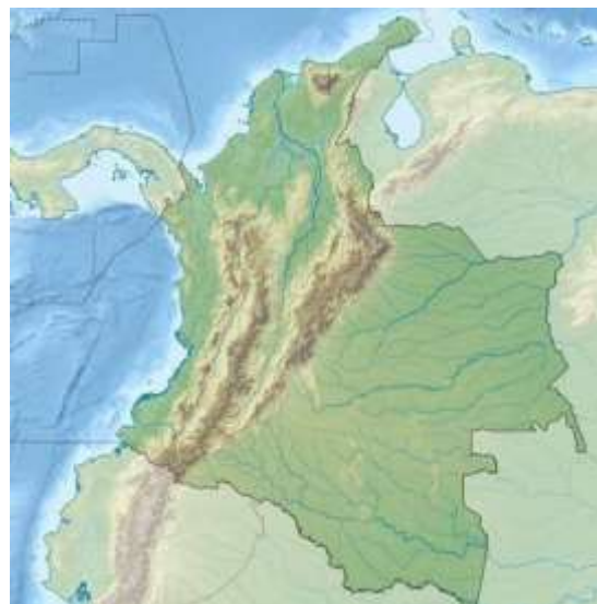
Mapa físico de Colombia

Colombia forma parte de Suramérica. Sus países vecinos son Venezuela, Ecuador, Perú, Brasil y Panamá. Tiene 1.141. Km 2 . Colombia posee dos fachadas marítimas (mar Caribe que permite un acceso fácil al Océano Atlántico, y la fachada del Océano Pacífico). Parte del Norte (parque nacional del Darién) selva tropical. La cordillera de los Andes se termina en una zona tupida y pantanosa 1 y hacia la frontera con Brasil se hallan los páramos de de la zona amazónica. Esta geografía explica, de cierta manera, la distribución de las poblaciones en el país como los problemas vinculados a la