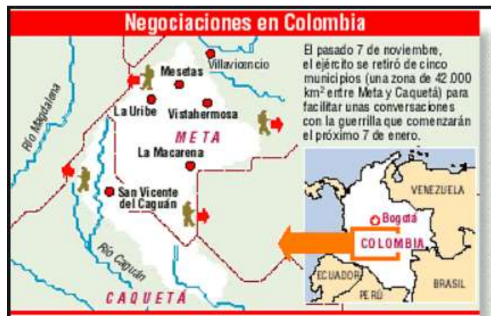
“Zona de despeje del Caguán”, el País digital , 8 de noviembre de 1998

Pero esta tentativa de paz resultó un fracaso 16 ya que se intensificó la violencia y se reforzó la guerrilla por la ausencia del ejército . En los años 2000, las FARC contaban con unos 17.000 guerrilleros repartidos en 7 zonas regionales y esta dispersión constituyó una gran ventaja 17 para actuar en todo el país. Sin embargo, esta dispersión también representó una desventaja en la medida en que 18 impedía la buena comunicación y una verdadera cohesión entre sus miembros.