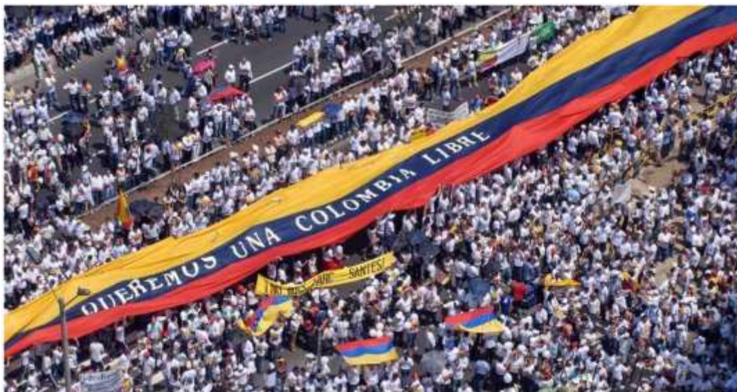
Con la consigna "No más FARC" casi 4 millones de colombianos salen a manifestar el 4 de febrero de 2008. Periódico digital Semana 26 .

Se puede considerar esta fecha como el despertar de una sociedad, antes asustada 27 por el miedo. Dispuesta ahora a actuar para que la paz volviera 28 al país. El 6 de marzo los ciudadanos protestan contra las acciones violentas de los paramilitares.