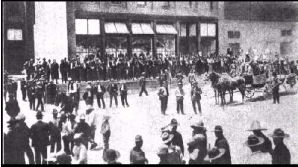
Tienda de raya en Cananea custodiada por los soldados estadounidenses durante la huelga de 1906

Sin embargo, en Cananea 4 (de junio de 1906), en una mina de cobre norteamericana hubo una revuelta y los trabajadores se declararon en huelga para obtener los mismos derechos que los trabajadores «gringos». Todo se acaba con una matanza.