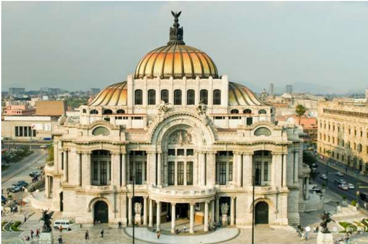
Palacio de Bellas Artes de México. D.F;

Tanto es así que don Porfirio estaba muy orgulloso de haber desarrollado una red ferroviaria de unos 2.000 kilómetros (tendrá una importancia capital durante la Revolución). Esta prosperidad se notaba sobre todo en las grandes ciudades. En México D.F, por ejemplo, se habían construido varios edificios de la «Belle époque como el Palacio de Bellas artes o el edificio central de Correos»