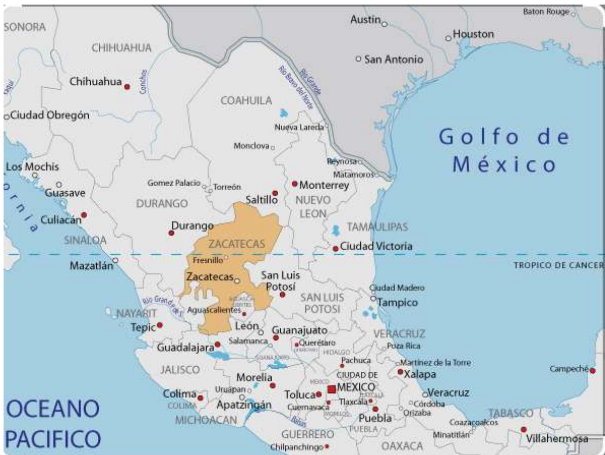
Mapa de México.

En este clima de malestar generalizado, los partidos opositores iban a reunirse formando un bloque coherente y determinado a acabar con el «viejo león». Paradójicamente fue el menos sobresaliente que logró federar el descontento general:FrancisoI .Madero. Originario de unafamiliaantigua de Coahuila.