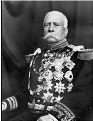
Porfirio Díaz, presidente de México

El periodo prerrevolucionario se distingue por un descontento social profundo que se viene existiendo desde hace treinta años. A este descontento se añade la revuelta de la burguesía cansada de una dictadura larga de 30 años. Porfirio Díaz lleva treinta años en el poder.