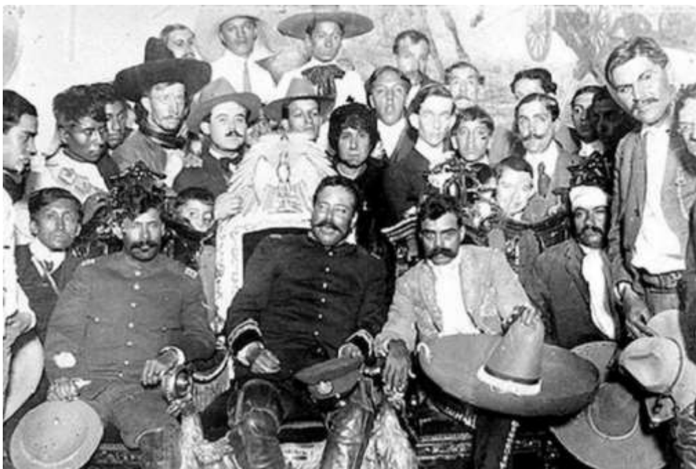
La icónica fotografía de Pancho Villa en México D.F, por Víctor Casasola

Desde el principio de la revolución el “coronel” Villa adopta los principios de la guerrilla, fundada en la movilidad y el efecto de sorpresa, en la fogosidad y la valentía ( fougue et bravoure ). Luego de la huida de Díaz se convierte en general de los federales para luchar contra la rebelión de su antiguo amigo Orozco. Su insubordinación causa su encarcelamiento, pero se fuga de la cárcel y se refugia en los E.E.U.U. luego del asesinato de Madero, el presidente legítimo, retoma las armas contra el traidor (Huerta, 1913). Tome el control de los estados norteños y participa en la toma de la ciudad de México ocupando la capital en 1914. Fue en aquel momento cuando se realizó una de las fotografías más famosas de la Revolución mexicana.