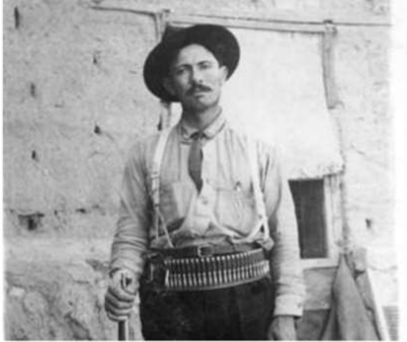
Pascual Orozco, 1912

El 20 de noviembre de 1910 se subleva contra Díaz -respondiendo al Plan de San Luis de Potosí- con un grupo de mineros en el sur del estado de Chihuahua. Luego de varios episodios de revueltas se asocia a Pancho Villa para apoderarse de Ciudad Juárez: lo que empuja Díaz a renunciar a su cargo presidencial y a exiliarse a Francia (25 de mayo de 1911; muere allí cuatro años más tarde).